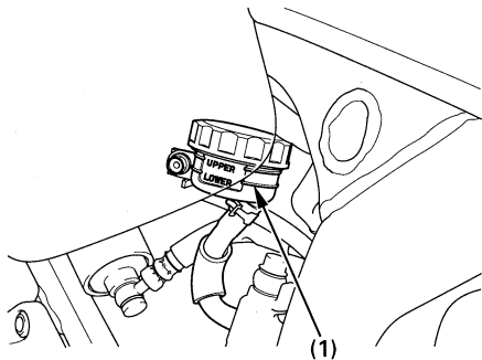
(1) Repère de niveau inférieur (LOWER)

S'assurer que le liquide se trouve au-dessus du repère de niveau minimum (1) avec la moto à la verticale.